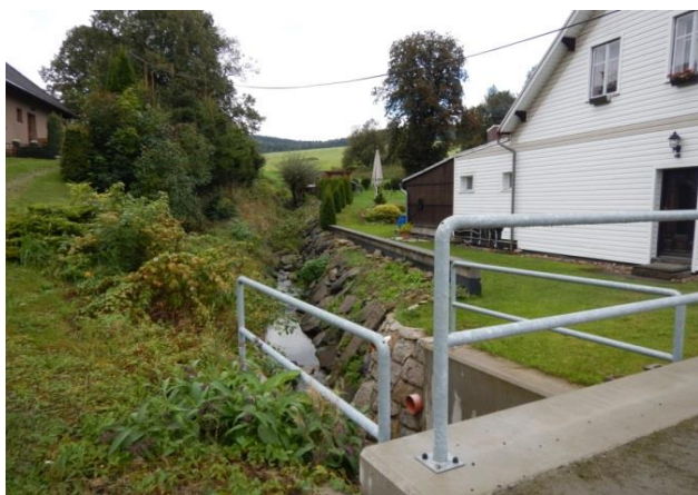
Místo kritického bodu- propustek pod silnicí podél Jeřice

Ohrožení zvýšenými průtoky z extravilánu. Propustek drobného vodního toku pod silnicí.