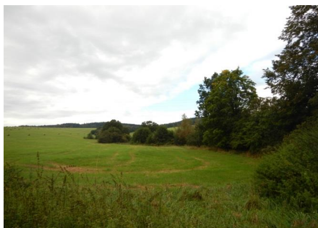
Údolnice směřující do kritického bodu